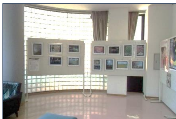
昨年度の展示風景